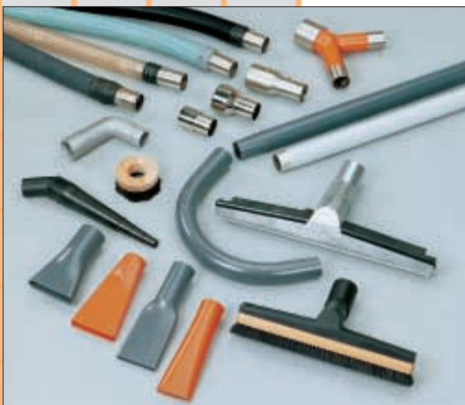
Een greep uit het assortiment accessoires van Kiekens.

* andere voltages op aanvraag. ** gemeten aan de inlaat. *** gemeten op 1,5 m.